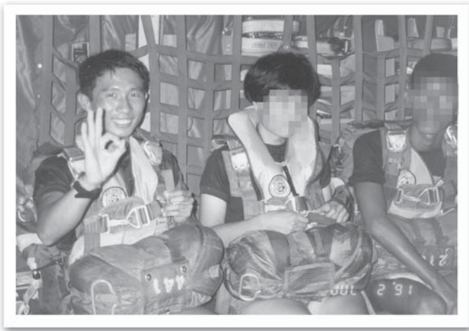
กระโดดร่มลงน้ำ (อยู่บนเครื่อง)

เรื่องอุบัติเหตุที่เกิดจากการกระโดดร่มเป็นเรื่องที่อาจจะเกิดได้ตลอดเวลา มีหลายครั้งที่เราอาจจะเป็นผู้ประสบเอง การมีสติที่ดีนั้นจะช่วยให้เราแก้ปัญหาที่เกิดขึ้นได้ อย่างมีครั้งหนึ่งนั้นรุ่นพี่ของคนหนึ่งซึ่งเป็นผู้บังคับกองร้อย (ท่านที่เป็นครูจุ่มของผม)