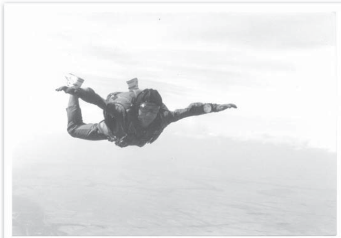
กระโดดดิ่งพสุธา