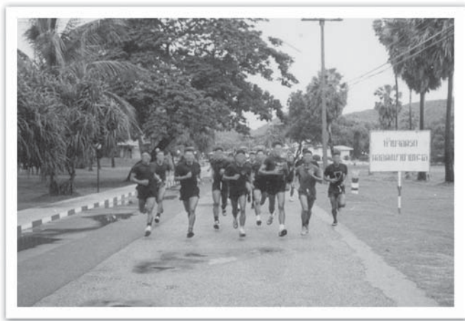
วิ่งกับกำลังพล ในหลักสูตร Combat diver

ด้วยจังหวะที่พอเหมาะทันทีที่ผมย้ายไป ผมไปรายงานตัว เข้าเรียนหลักสูตรแทรกซึมเบื้องสูง (กระโดดร่มแบบกระตุกเอง) เนื่องจาก หลักสูตรนี้เปิดพอดี เมื่อจบการศึกษาาก็กลับมาที่หน่วย ซึ่งจะมีกำลังพล ที่เรียกได้ว่า เลือ-สิงห์-กระต๊อง-แรด ด้วยความที่เราเป็นคนใหม่ที่ ในหน่วยนั้นเราก็ต้องถูกลองของเป็นธรรมดา แต่ผมก็ถือคติว่าถึงแม้ว่า เราจะไม่ใช่เป็นคนที่เก่งที่สุด แต่เรามีความจริงใจ เราไม่ได้มาเอาเปรียบ เขาเหล่านั้น เรามาปกครองเขา