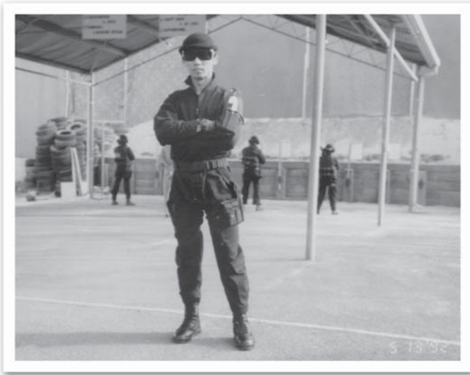
สนามยิงปืนระยะประชิด ที่ออสเตรเลีย

ข้างในมีห้องที่สามารถเลื่อนฉากไปมาได้หลายรูปแบบ สามารถใช้กระสุนจริงยิงได้ทุกห้อง ภายใน CQB ก็จะมีกล้องวิดีโอ ทุกมุมเพื่อวิเคราะห์ว่าแต่ละคนนั้นปฏิบัติเป็นอย่างไรใน CQB การปฏิบัติใน CQB เราก็จะใช้ Flash Blank (ระเบิดที่มีแต่แสงและเสียง)