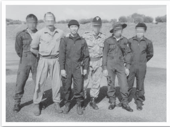
ถ่ายจากสถานที่ฝึกปิดลับแห่งหนึ่ง หลังจากฝึกประกอบระเบิดที่ใช้สำหรับ บุกเบิกเข้าสู่อาคาร (ที่เห็นเทปสีดำสั้นๆ ติดตามขาทางแกว เอาไว้ยี่ดระเบิดกับกรอบไม้เวลาประกอบระเบิด)

เพ็ญที่หน่วยของผมได้โบกี้รถไฟที่ไม่ใช่แล้ว มา 2 โบกี้ เอาไว้ใช้ฝึก เราเลยขอไปทางการรถไฟ ขอหัวรถจักรมาลากไปฝึก สมมุติ สถานการณ์ว่า มีการจับตัวประบนรถไฟสายใต้ ซึ่งเราตัดสินใจจะเข้า ช่วยเหลือตัวประกัน ขณะที่รถไฟกำลังวิ่ง เราก็ตอบใช้ ฮ. บินตามรถไฟ ที่กำลังวิ่ง แล้วกระโดดตัวเปล่าลงหลังคารถไฟที่กำลังวิ่งกัน คราวนี้ เราตัดสินใจใช้ปืนพกกันเพราะว่า ถ้าใช้ปืนกลมือ อย่าง MP-5 แล้ว เราจะเหวี่ยงตัวเข้าไปไม่สะดวก ตอนแรกก็พยายามจะเข้าทางหน้าต่าง กัน แต่ว่าไม่รู้จะเหวี่ยงตัวจากหลังคารถไฟกันอย่างไรวีงพลาด ละก็อาจจะตัวขาดเป็นท่อนๆ ก็ได้ เราเลยตัดสินใจลงที่รอยต่อระหว่าง โบกี้ พอแต่ละทีมีกระโดดลงบนหลังคารถไฟ เราก็ตอบแยกย้ายลงไป ทางหัวและท้ายโบกี้ เมื่อทุกคนเข้าที่เราก็ตอบส่งสัญญาณเข้าพร้อมกัน