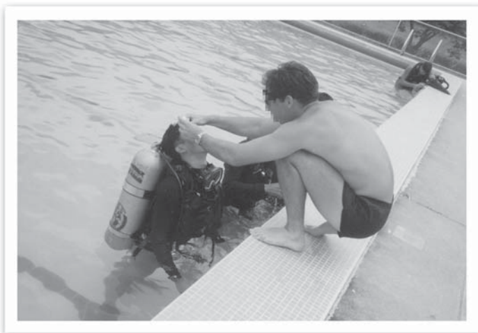
เรียน Combat diver ฉิวแตก

ผมเองต้องไปคุยกับเขาบอกให้เขาอดทน เราฝึกกันไปไม่นาน ผมเองยังแยเลยแต่เราก็ต้องทน คุยสักพักใหญ่เขาก็กลับไปเรียนต่อ