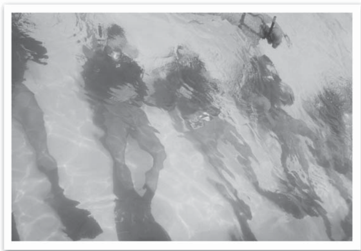
เรียน Combat diver ฝึกในสระน้ำก่อนออกไปตรวจทุ่นระเบิดใต้ท้องเรือ