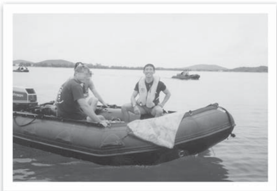
เรียน Combat diver บนเรือยาง

เรื่องความมั่นใจในการปฏิบัติงานใต้น้ำก็มีคนตกไปหลายคน บางคนนั้นสอบผ่านทุกอย่างแล้ว แต่ออกทะเลวันแรกพร้อมอุปกรณ์ ปรากฏว่าวันนั้นคลื่นลมแรงมากเรายังไม่ทันถึงจุดปล่อย เรือยางที่เรา นั่ง ออกไปคว่ำ มีคนหนึ่งตกใจร้องโหวกเหวกโวยวาย ทุ้งๆ ที่มีอุปกรณ์ ติดอยู่ที่หลัง หลายคนเลยต้องเข้าไปช่วย เมื่อกู้เรือพลิกเรือกลับเสร็จ คนนั้นก็ไม่ได้ดำ และต้องออกจากหลักสูตรไป