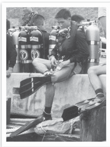
เรียน Combat diver เตรียมตัวลงฝึกสำรวจทุ่นระเบิดใต้ท้องเรือ ที่บริเวณท่าน้ำลี้ก