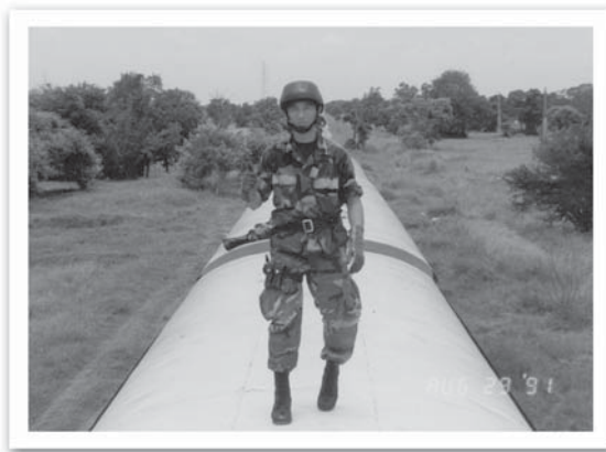
หลังการรถไฟหลังจากกระโดดลงมาจากรถ