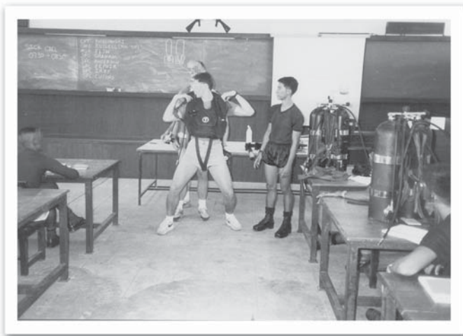
เรียน Combat diver เป็นล่ำมในหลักสูตร

ภารกิจจากการต่อต้านการก่อการร้ายสากล และรักษาความปลอดภัยบุคคลสำคัญ ไปเป็นปฏิบัติการพิเศษ ซึ่งจะต้องปฏิบัติการได้ในทุกสถานการณ์ และภูมิภาค ทางหน่วยของผมเลยได้รับการสนับสนุนชุดครุยฝึกจากรบพิเศษ สหรัฐฯ พร้อมอุปกรณ์โดยจัดกำลังมาจาก 1st Special Force Group, US ARMY ได้รับการสนับสนุนหลักสูตร Combat Diver เป็นจำนวน 2 รุ่น โดยรุ่นแรกจัดกำลังจาก 2nd Battalion และรุ่นที่ 2 จัดกำลังจาก 1st Battalion โดยใช้พื้นที่การฝึกที่ฐานทัพเรือ ลัตทีบ