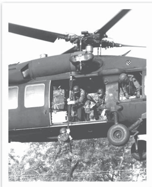
วิธีการลงจาก ฮ. (UH-60 Black Hawk) ด้วย Fast Rope

ทีมผมที่จะเข้าไปแบ่งออกเป็นสองส่วน ส่วนหนึ่งจะกระโดดร่มลง (sniper) อีกส่วนจะลงโดย fast rope (เป็นเชือกที่ถักจากขนแกะ เส้นผ่าศูนย์กลางประมาณ 2 นิ้ว เราสามารถโรยตัวลงจากที่สูงโดยไม่ต้องใช้ snap link เวลาจะหยุดก็แค่บิดมือเข้าหากัน) ส่วนโจมตีคือผมและลูกน้องอีก 4 คน จะลงโดย fast rope ส่วน sniper จะกระโดดร่มลง ทีมของผมนั่ง UH-60 เมื่อถึงที่หมายเราก็ลง โดยผมลงเป็นคนแรก เมื่อถึงพื้นเราทำการระวังป้องกัน เมื่อ UH-60 บินจากไป เราก็เริ่มออกเดิน เดินไปได้ประมาณ 5 นาที UH-60 ก็ยังบินวน เพื่อตรวจสอบว่าทุกทีมปลอดภัย