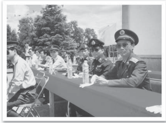
ติดตาม ผบ.ทบ. ไปจีน ที่คุนหมิง