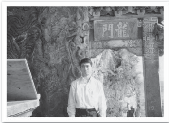
ติดตาม ผบ.ทบ. ไปจีน

เคยมีหลายคนเรียกผมไปคุยด้วยเพื่อที่จะหาข้อมูลว่า ผบ.ทบ. ท่านจะไปไหนอย่างไรมีกิจวัตรอะไร ผมเองก็ต้องระวังเรื่องเหล่านี้ เพราะว่าผมเองนั้นก็ทำงานทางด้าน รปภ. ประจำตัวท่านอีกด้วย นอกจากนี้ นักข่าวสายทหารเองนั้นก็มักจะชอบมาคุยกับนายทหารคนสนิทของนายทหารชั้นผู้ใหญ่ ส่วนผมเองนั้นก็พยายามหลบ หรือไม่ค่อย