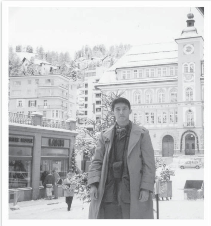
ติดตาม ผบ.ทบ. ไปสวิสฯ