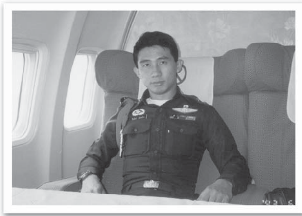
ติดตาม ผบ.ทบ. ไปจีน บนเครื่องบินรับรองของจีน

สุโขทัยฯ นั้นราคาไม่แพง ในที่สุดก็มีลูกน้องผมหลายคนตัดสินใจเรียน ก็คิดว่าหลายคนคงจบการศึกษากันแล้ว ในปัจจุบัน (ผมเองนั้นไม่ได้ ติดต่อกลับไปที่หน่วยเก่าเลยไม่ทราบว่าเป็นอย่างไรกันบ้าง แต่ก็ได้ข่าวว่า ได้รับพระราชทานยศ เป็นนายทหารสัญญาบัตรไปแล้ว 2 คน)