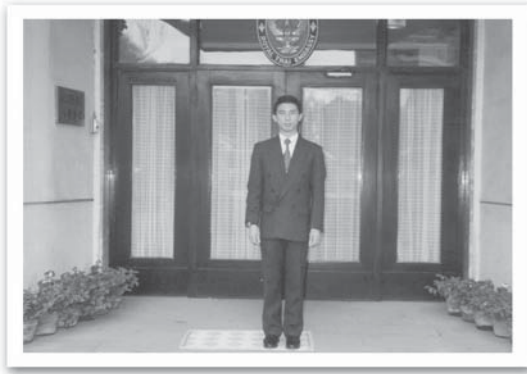
ติดตาม ผบ.ทบ. ไปจีน หน้าสถานทูตไทย ที่ปักกิ่ง