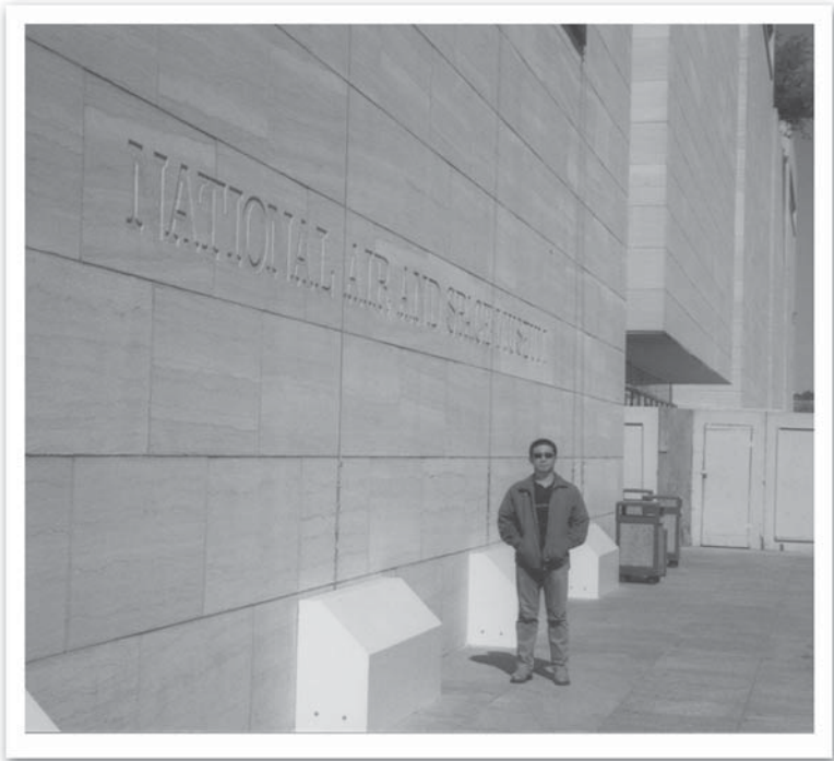
ถ่ายที่ วอชิงตัน ดี ซี