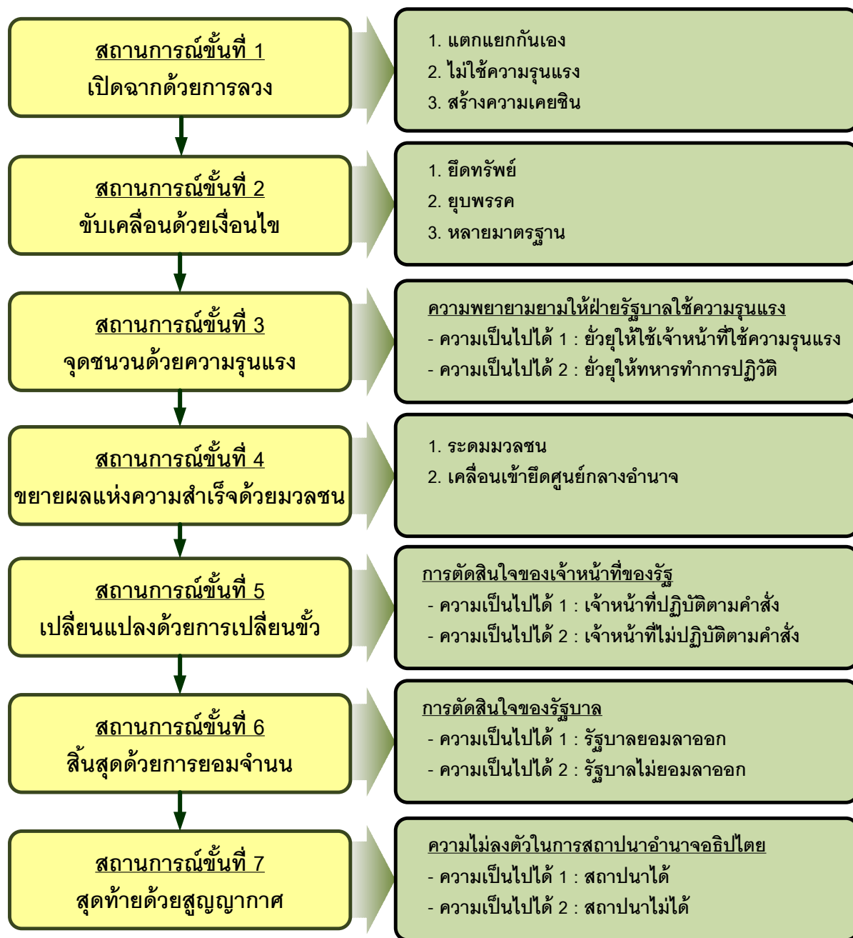
ภาพที่ 3 ฉากทัศน์ที่เลวร้ายที่สุดของประเทศไทย

3.2.3 สถานการณ์ขั้นที่ 3 จุดชนวนด้วยความรุนแรง : สถานการณ์ขั้นนี้ก็จะเกิดขึ้นหลังจากใช้เงื่อนไขต่างๆ ในการกำหนดวันเวลาในการเคลื่อนย้ายแล้ว กลุ่มทุนใหม่มีแนวโน้มที่จะช่วยทำให้เกิดความรุนแรง ซึ่งหากการช่วยประสบความสำเร็จจะส่งผลให้สถานการณ์เคลื่อนไปในขั้นที่ 4 ต่อไป โดยการช่วยทำให้เกิดความรุนแรงขึ้นนั้นมีความเป็นไปได้ใน 2 ลักษณะคือ 1) การเผชิญหน้ากันระหว่างเจ้าหน้าที่ของรัฐที่ออกมารักษาความสงบเรียบร้อยกับมวลชนระลอกแรก ในความเป็นไปได้นี้จะสัมฤทธิ์ผลโดยเร็วหากเจ้าหน้าที่ที่ออกมารักษาความสงบเรียบร้อยถูกสั่งให้ออกมาพร้อมกับอาวุธปืน ในลักษณะเดียวกันกับเหตุการณ์สลายผู้ชุมนุมที่บริเวณสามเหลี่ยมดินแดง ถนนวิภาวดีรังสิตเมื่อ 13 เม.ย.52