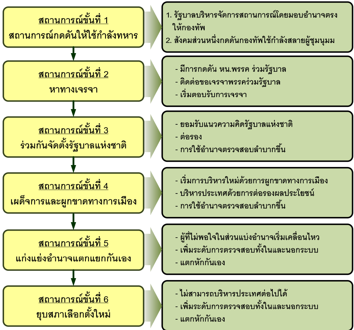
ภาพที่ 4 การคลี่คลายตัวไปสู่การจัดตั้งรัฐบาลแห่งชาติ

ต่อการสูญเสียภาวะสมดุลจากปัญหาภายใน และนำไปสู่ความขัดแย้งครั้งใหม่ การคลี่คลายตัวในรูปแบบนี้จะ เป็นไปดังภาพที่ 4