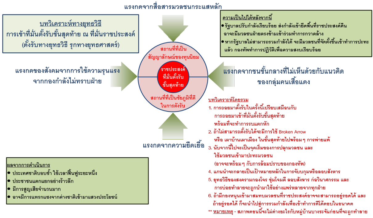
ภาพที่ 1 บทวิเคราะห์ทางยุทธการ : เข้าที่มั่นตั้งรับชั้นสุดท้าย ณ ที่มั่นราชประสงค์