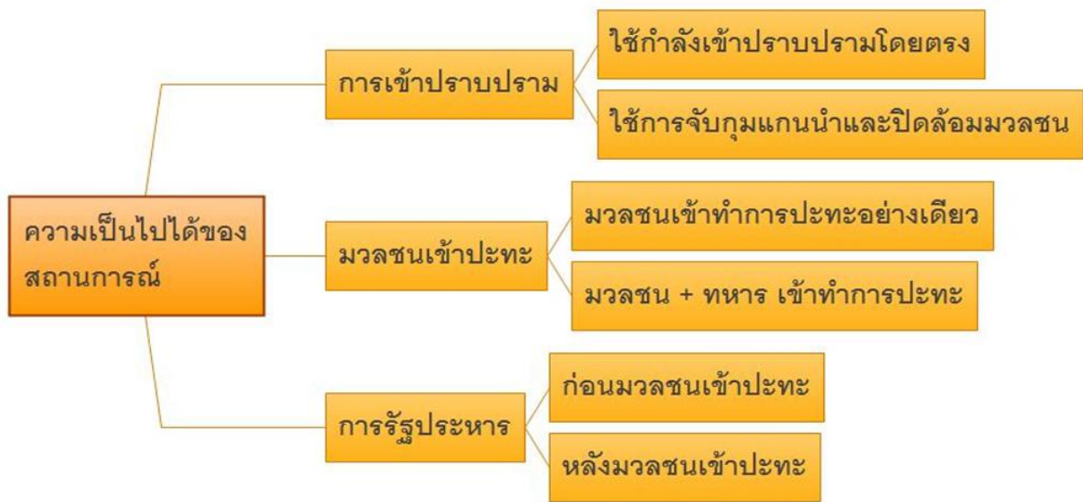
ภาพที่ 2 สามแพรงแห่งความรุนแรง เมื่อฝ่ายนิยมความรุนแรงมีอิทธิพลในการตัดสินใจ