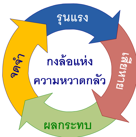
รูปที่ ๒ กงล้อแห่งความหวาดกลัว

๒.๒.๑ ความรุนแรง (Violence) : กลุ่มก่อการร้ายจะเลือกใช้ความรุนแรงเป็นจุดเริ่มในการดำเนินการ โดยความรุนแรงที่เลือกใช้นั้นจะเป็นสิ่งที่บุคคลทั่วไปไม่สามารถยอมรับได้ว่าเป็น เรื่องปกติในชีวิตประจำวัน เช่น การฆ่าตัดหัวตัวประกัน หรือ การระเบิดฆ่าตัวตาย เป็นต้น