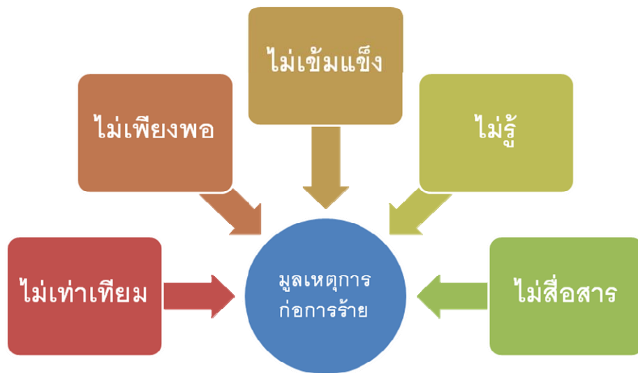
รูปที่ ๑ มูลเหตุของการก่อการร้าย

๒.๑ มูลเหตุแห่งการก่อการร้าย การก่อการร้ายในปัจจุบันจะมีมูลเหตุที่สำคัญที่นำไปสู่การก่อการร้ายของกลุ่มก่อการร้าย ๕ ประการ ดังแสดงในรูปที่ ๑ โดยกลุ่มก่อการร้ายที่เกิดขึ้นใหม่หรือดำรงอยู่ในปัจจุบันจะมีมูลเหตุสำคัญของการก่อการร้ายที่มีสาเหตุมาจากอย่างน้อยหนึ่งประการจาก ๕ ประการ สำหรับรายละเอียดของมูลเหตุแห่งการก่อการร้ายสามารถอธิบายได้ดังนี้